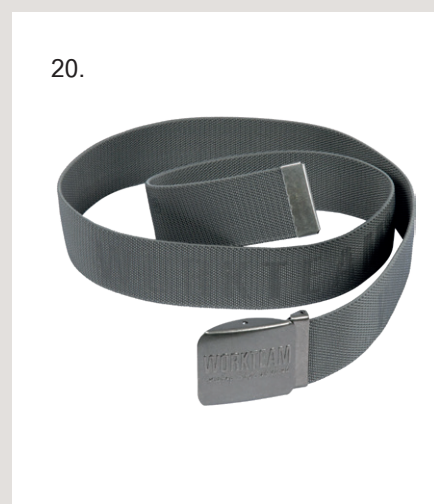
11. Chapéu de safari reflexivo · Ref. Nº WFA930. 12. Luva de serragem · Ref. Nº G2205. 13. Mochila em tecido Ripstop combinada · Ref. Nº WFA407. 14. Boné de alta visibilidade · Ref. Nº WFA907. 15. Meias, pack de três pares, com elástico anatômico no peito do pé e na parte alta da meia · Ref. Nº WFA022. 16. Gola de ponto multifunção · Ref. Nº WFA109. 17. Bota de serragem sem cordões · Ref. Nº P2511. 18. Mochila enrolável com uma capacidade de 25l · Ref. Nº WFA408. 19. Boné com faixa refletora flúor · Ref. Nº WFA909. 20. Cinto têxtil · Ref. Nº WFA501.