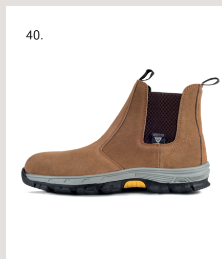
31. Boné tripla cor com tecido canvas · Ref. Nº WFA941. 32. Mochila combinada com uma capacidade de 30 L · Ref. Nº WFA409. 33. Gola de ponto multifunção · Ref. Nº WFA107. 34. Sapato combinado com cordões · Ref. Nº P3010. 35. Gola de ponto multifunção · Ref. Nº WFA108. 36. Sapato combinado com cordões · Ref. Nº P3012. 37. Boné em tecido canvas combinado com tecido de ganga · Ref. Nº WFA940. 38. Cinto para ferramentas · Ref. Nº WFA552. 39. Mochila combinada com uma capacidade de 30L · Ref. Nº WFA409. 40. Bota de serragem sem cordoes · Ref. Nº P2511.